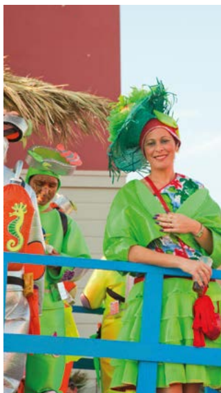
▲ Parada karnawałowa w stolicy Fuerteventury

W Puerto del Rosario hucznie obchodzi się karnawał. Mieszkańcy wylegają w przebraniach na ulice, aby wspólnie bawić się podczas parad. Organizowane są koncerty i konkursy, np. na najciekawszy strój oraz wybór królowej karnawału. Jednym z typowych dla Puerto del Rosario wydarzeń jest kolorowa Regata de Achipencos. Drużyny uczestników regat płyną po zatoce Puerto de Cabras przebrani w zabawne stroje, a ich wodnymi „rumakami” mogą stać się dowolne środki lokomocji lub przedmioty, byleby unosiły się na wodzie. Odpowiednikiem Achipencos na lądzie są wyścigi Arretrancos – na ulicach można zobaczyć wymyślne pojazdy skonstruowane specjalnie na bieg, w tym rydwany, samoloty, bolidy czy kolorowe samochodziki. Regata de Achipengos i Carrera de Arretrancos są kwintesencją karnawałowej zabawy.